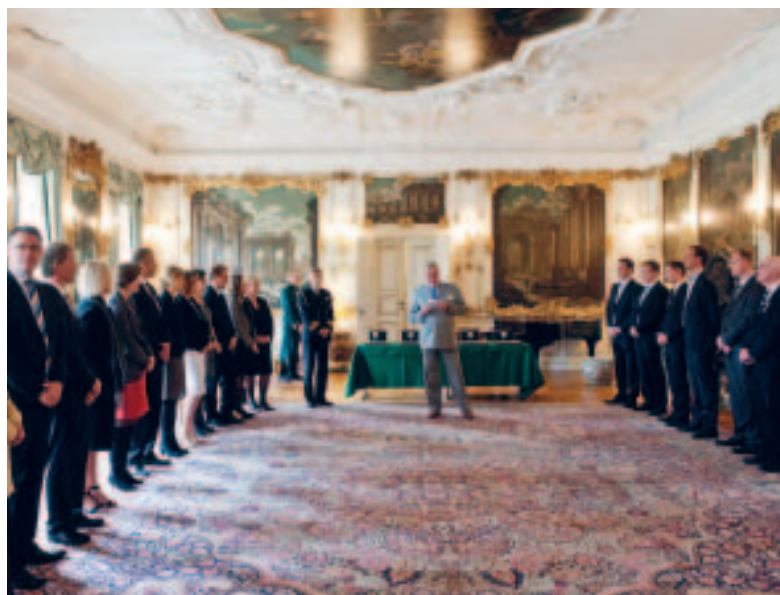
Prins Henrik er formand for komiteén for "Kong Frederik den Niendes Hæderspris" og modtog prismodtagerne og de øvrige gæster på Fredensborg Slot.