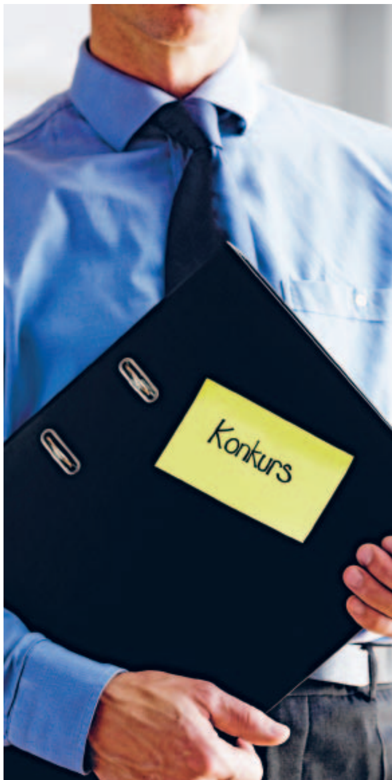
Konkursrådet kommer ikke med en endelig facitliste over hvilke elementer, der indgår i vurdering af groft uforsvarlig forretningsførelse. Men rod i regnskaberne vejer tungt.