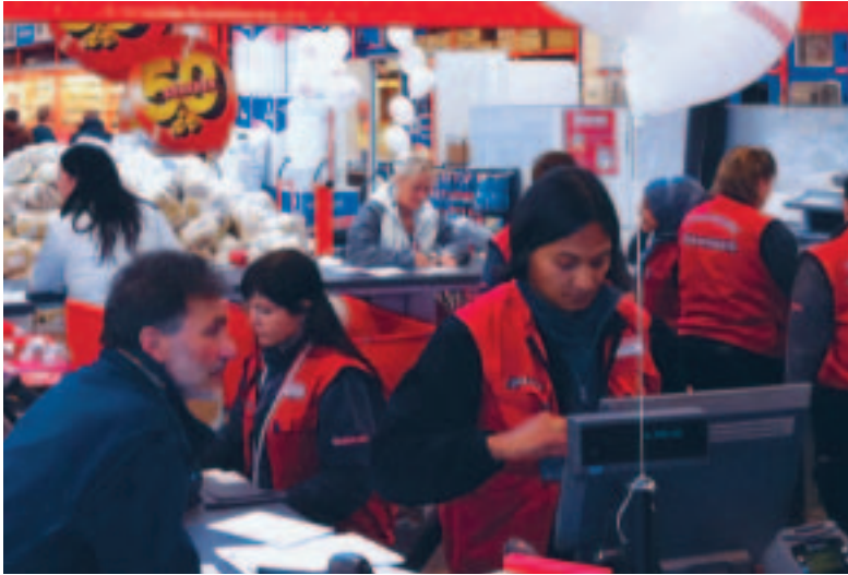
Hvert år slår BAUHAUS Danmark A/S 300-400 job op på portalen Jobzonen.